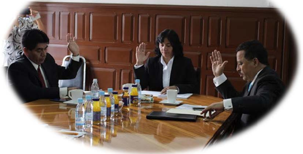
SESIÓN ORDINARIA DE LA COMISIÓN DE TRABAJO.