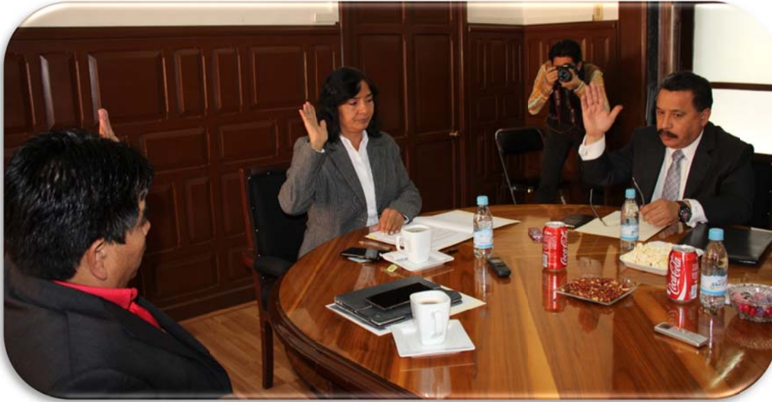
Asistencia a la Comparecencia de la Secretaría de Desarrollo Económico y Turismo: