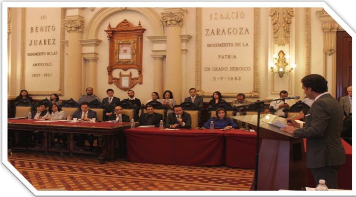
Asistencia a la Comparecencia del Sistema Municipal DIF: