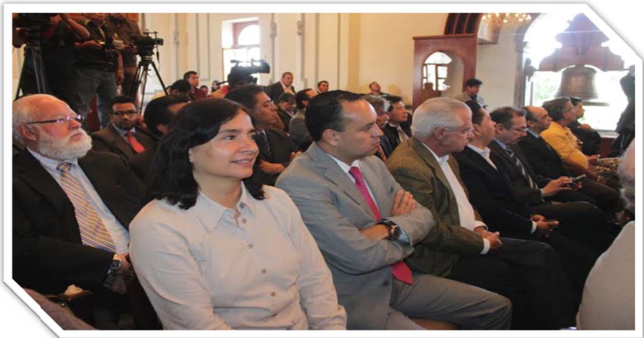
Asistencia a la “Feria Municipal de Empleo para la Mujer 2015”: