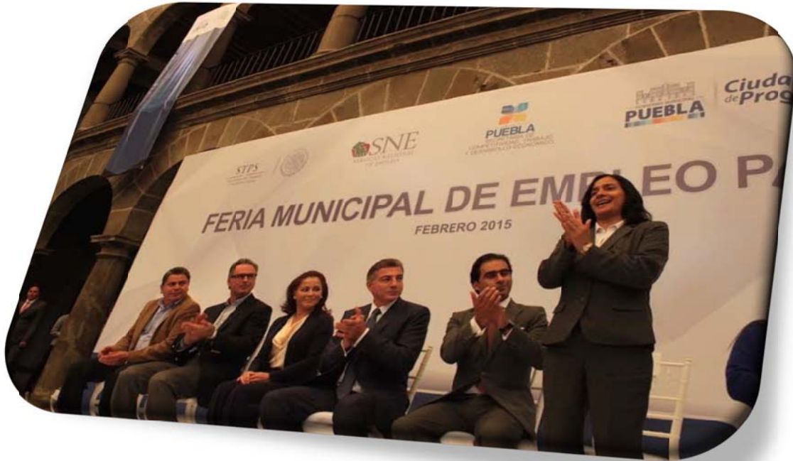
Asistencia a la Firma de Convenio BUAP-HONORABLE AYUNTAMIENTO DE PUEBLA: