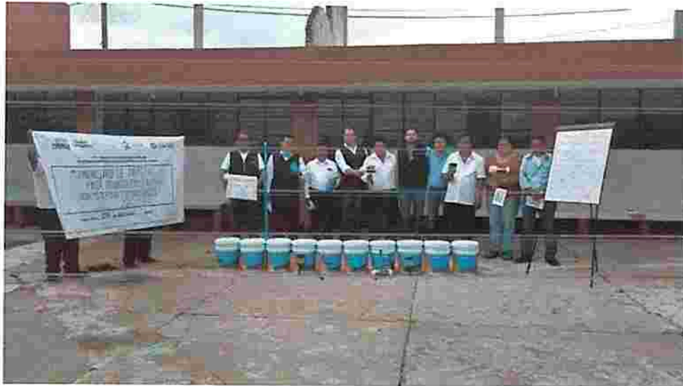
PINTURA Y MATERIAL PARA ESC. PRIM JOSE LOPEZ PORTILLO