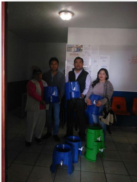
Entrega de Porta Garrafones de Agua