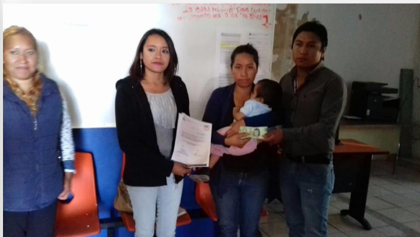
Entrega de Apoyo económico a escuelas.