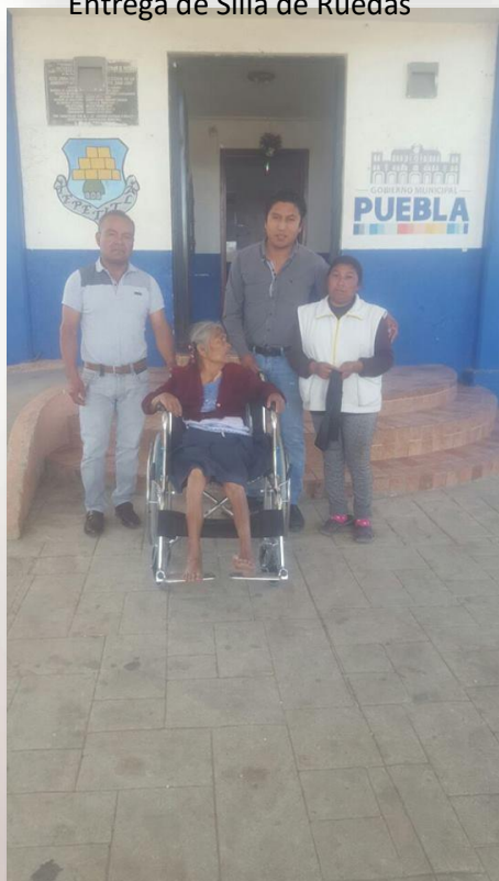
Entrega de Silla de Ruedas