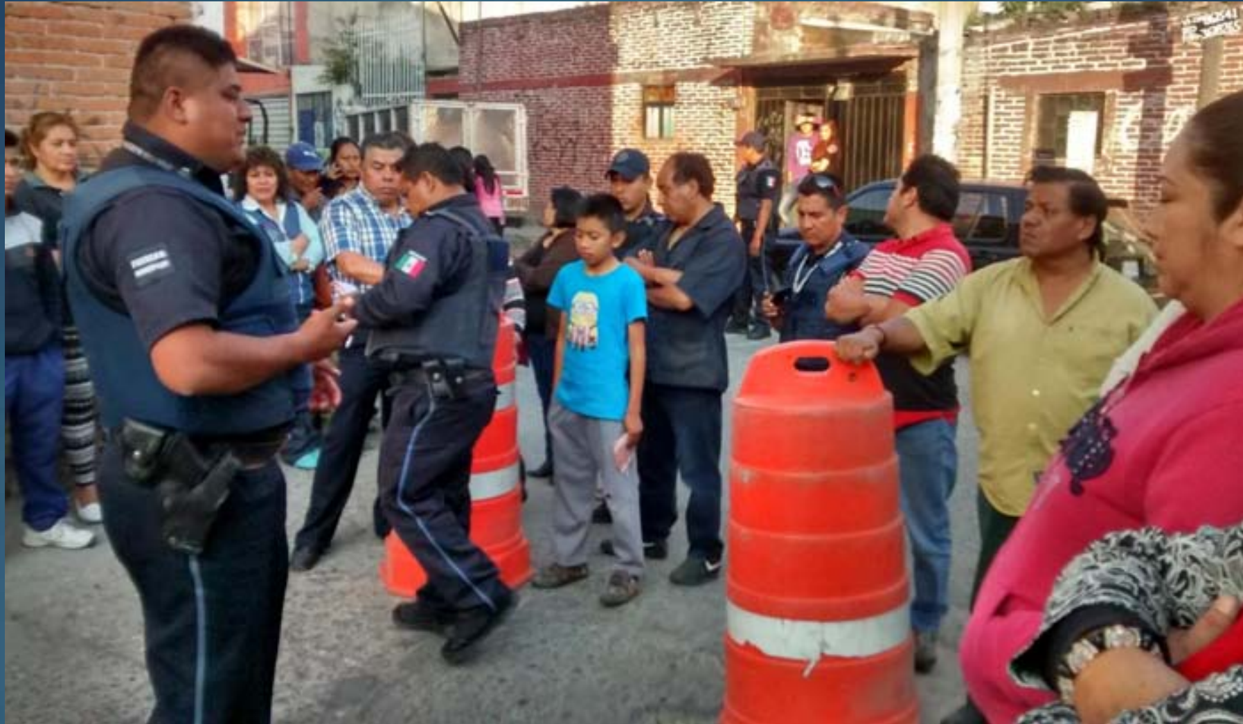
Reunión de prevención del delito con vecinos de la calle Benito Juárez