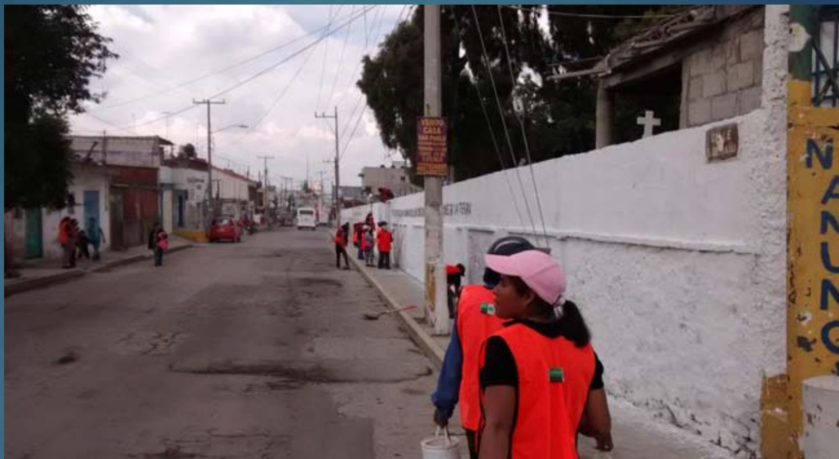
Pintura en la Barda del Panteón de la Comunidad