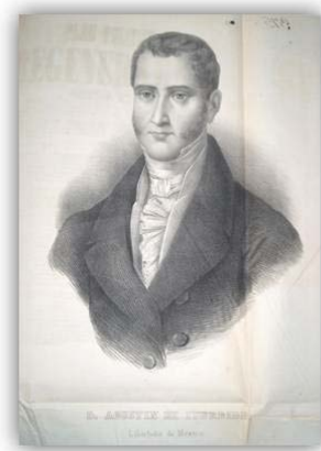
Retrato de Iturbide, 1857 Actas de cabildo, Vol. 123-A

Al frente del ejército trigarante, Iturbide hizo su entrada triunfal a la ciudad de México, terminando el régimen virreinal luego de una intensa lucha de once años. El 27 de septiembre de 1821 dejó de existir la Nueva España y nació México. 2