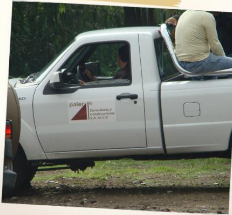
Felipe Vallejo manejando camioneta de Paler.