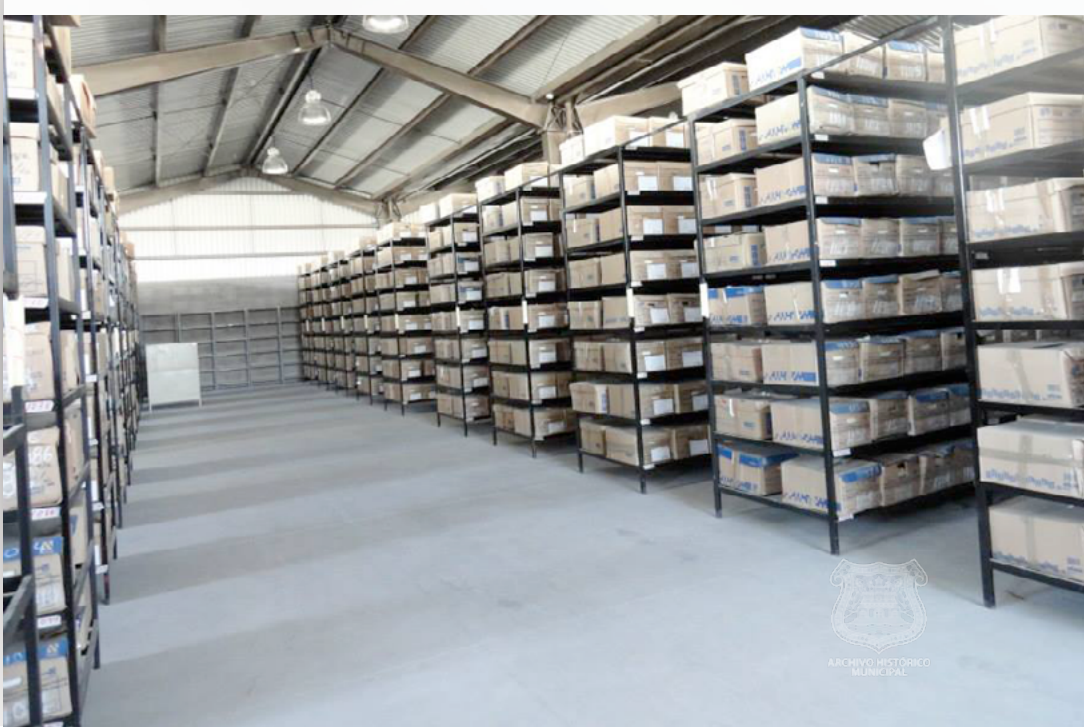
Acervo del Archivo de Concentración ubicado en Av. 15 de Mayo 4702-A, Col. Villa Posadas, Puebla. Archivo General Municipal de Puebla, imagen digital. Año 2014.