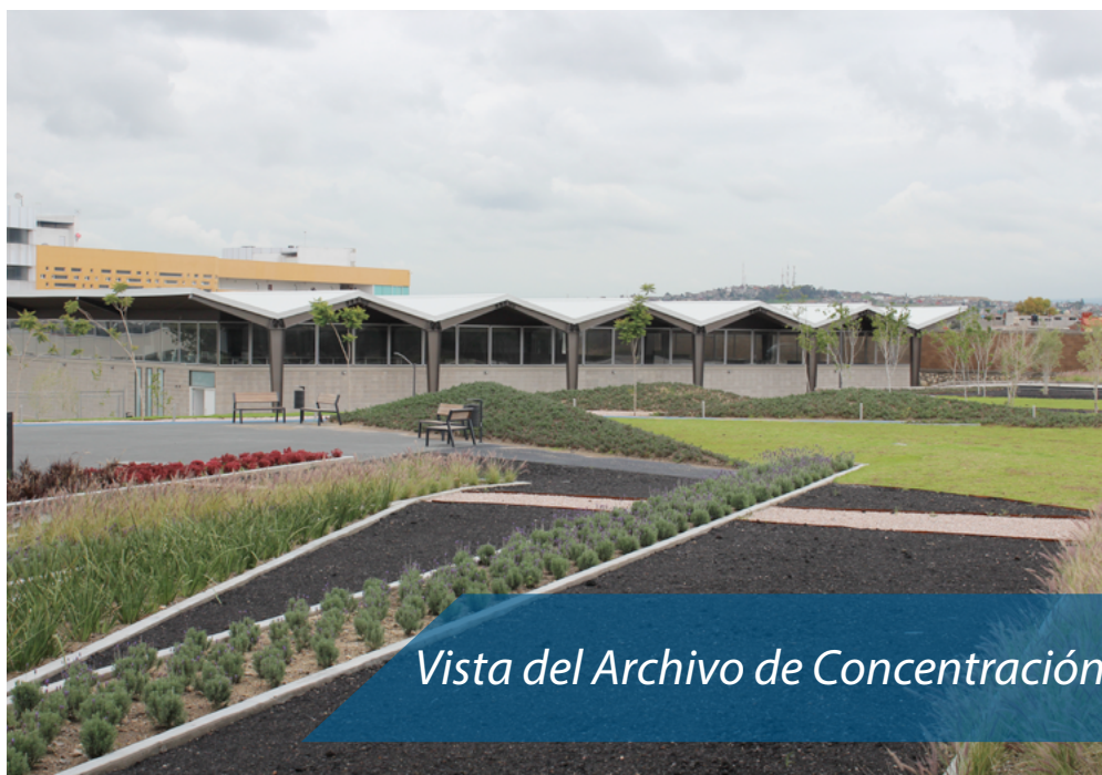
Vista del Archivo de Concentración

La grandeza de México se plasma fielmente en su patrimonio documental y bibliográfico. La conquista espiritual y cultural llevada a cabo