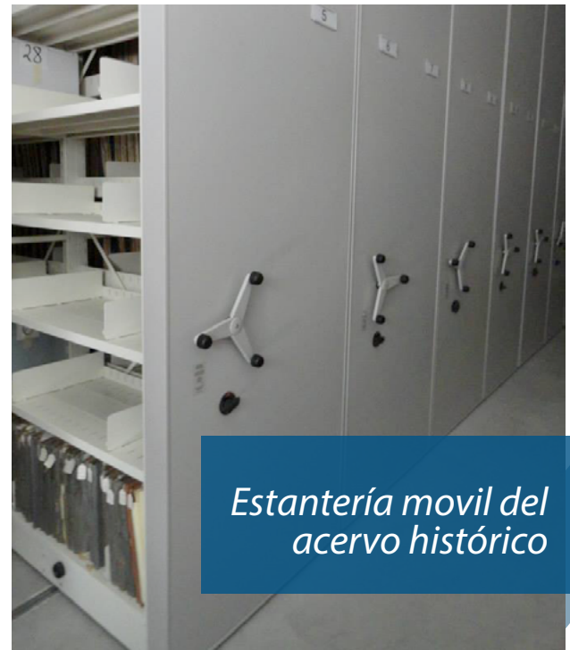
Estantería móvil del acervo histórico

Como se observa, la temporalidad de los documentos del Archivo Histórico ubicado en esta sede va de 1842 al 2014, con más de mil metros lineales de documentación; también cuenta con una biblioteca especializada en historia de Puebla, todo disponible a la consulta de la población en general. Estamos seguros que la singularidad de estas nuevas instalaciones, hará de su visita al Archivo, una grata experiencia.