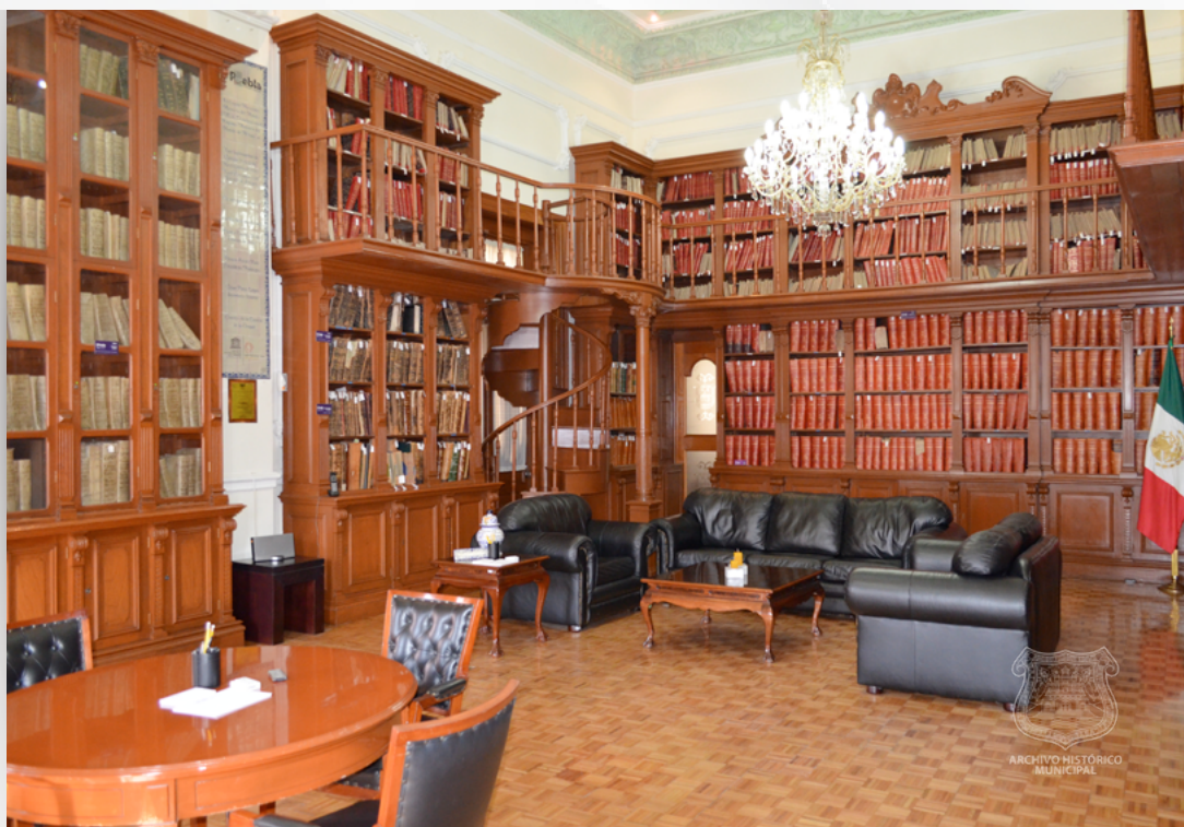
Acervo histórico actual ubicado en el Palacio Municipal, Puebla 24 de agosto de 2010.