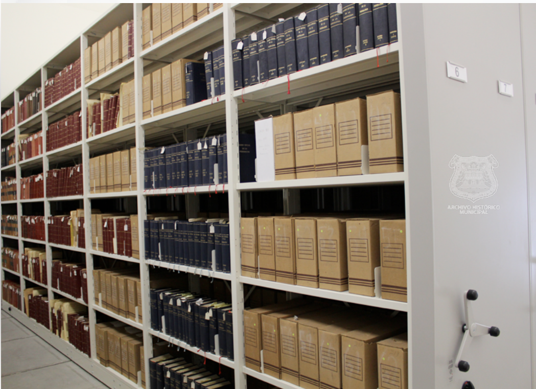
Acervo histórico ubicado en Av. 15 de Mayo 4702-A, Col. Villa Posadas, Puebla. Año 2014.