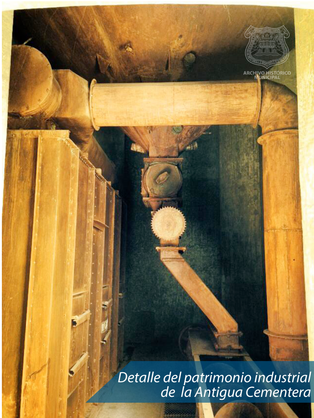
Detalle del patrimonio industrial de la Antigua Cementera

Estamos seguros que la nueva sede del Archivo General Municipal de Puebla se coloca como una de las mejores en su tipo, no solo a nivel nacional, sino también a nivel internacional, con una idea totalmente innovadora donde se combina patrimonio industrial y patrimonio documental, creando una “puesta en valor” (mise en valeur) que permitirá un interesante desarrollo inmobiliario a su alrededor y abriendo una veta de estudio de la historia de la industria cementera –todavía inexplorada en nuestro país-. Además, y lo más importante, es que abre una nueva mirada sobre este tipo de edificaciones en la ciudad y la posibilidad creativa de su rehabilitación.