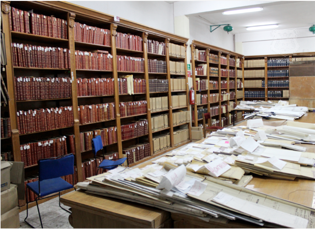
Acervo histórico ubicado en 32 poniente 2904, Col. Nueva Aurora, Puebla. Año 2012.