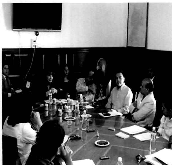
Mesa de trabajo de Comisiones Unidas con Servicios Públicos.