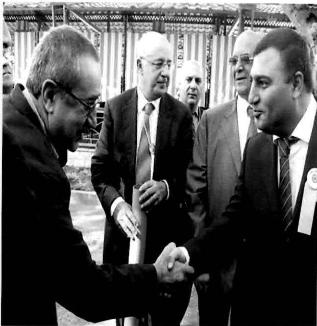
Reunión del Consejo de Administración de la OCPM en Ejiatsin, Armenia