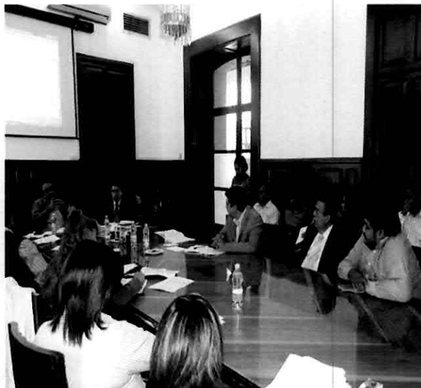
Mesa de trabajo para aprobar el Dictamen de Comparecencias de titulares 2012