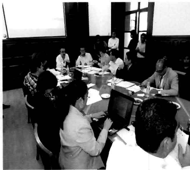
Mesa de trabajo tratando la problemática de trabajadores de base no sindicalizados.