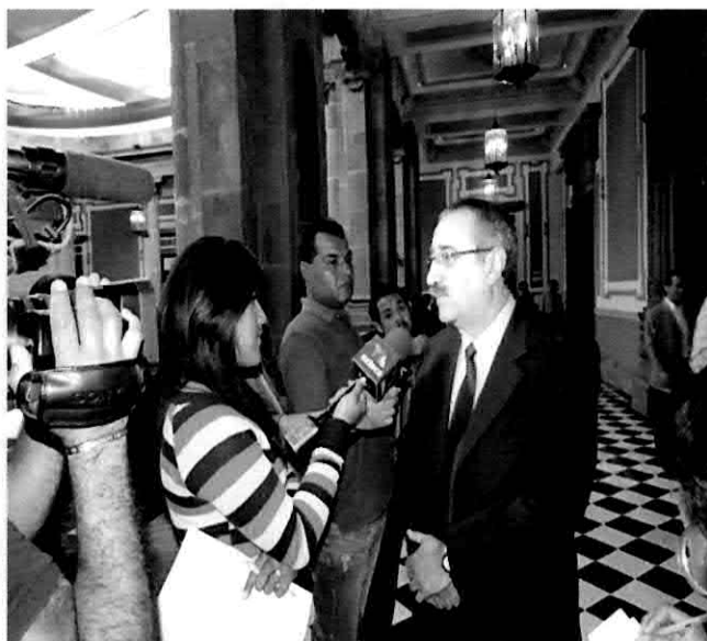
Entrevista con medios de comunicación sobre la problemática con el estacionamientos de los giros comerciales en la Av. 43 poniente.