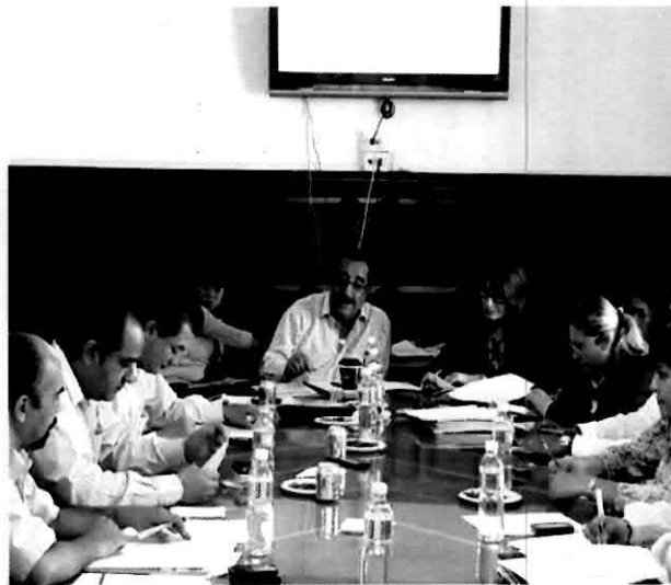
Mesa de trabajo tratando el reordenamiento del Mercado Temporal Jardín de Anasco.