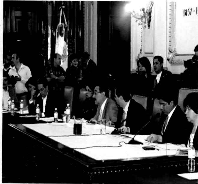
Interviniendo en Sesiones de Cabildo