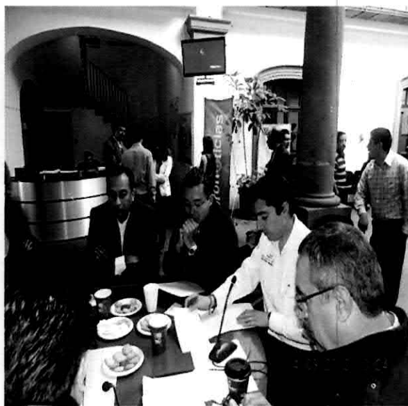
Rueda de prensa. Regidores informando a los medios diferentes temas