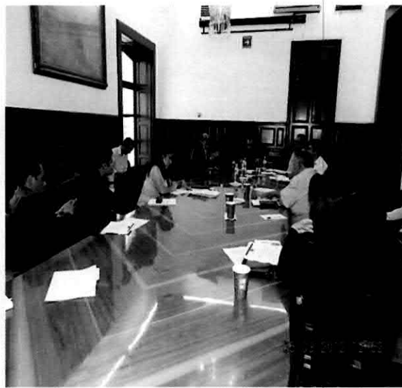
Mesa de trabajo Comisiones Unidas con Desarrollo Urbano y Obra Pública