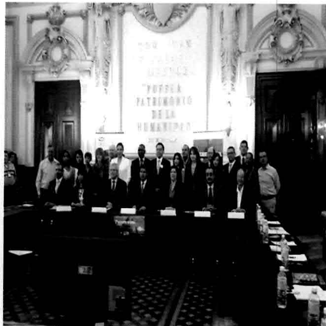
2º. Encuentro Regional de Ciudades Latinoamericanas y del Caribe 2012 de la OCPM.