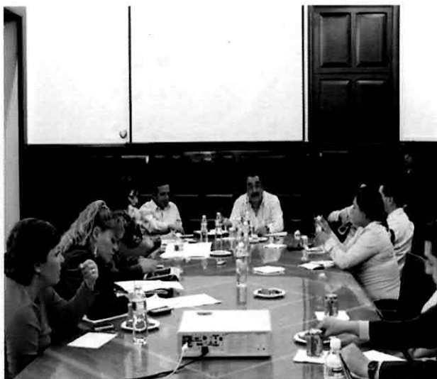
Mesa de trabajo tratando la problemática que se presenta en las Juntas Auxiliares.