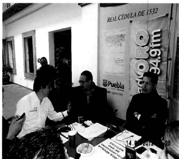
Entrevista con Radio Oro informando sobre los trabajos que se realizan en las diferentes Comisiones.