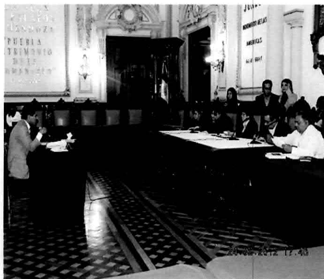
Interviniendo en la Comparecencia 2012 del titular del Sistema Municipal DIF, siendo la Comisión moderadora la de Grupos Vulnerables