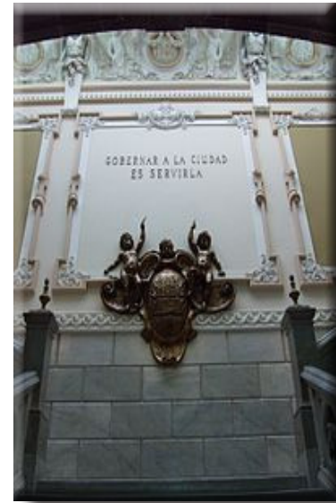
Actual Palacio Municipal

Ferica del actual Pasaje y donde habían habitado los anteriores alcaldes mayores se ubicó la cárcel que aún servía para tal fin en 1780, las piezas altas funcionaban como prisión de mujeres, capilla de ajusticiados, salas de tormentos y de visitas, esta última tenía comunicación al corredor de la vivienda de los gobernadores (1754-84).