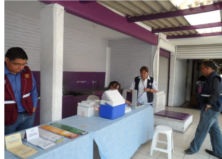
Jornada de salud en el Mercado La Libertad "El Cuexcomate" jueves 29 de marzo de 2012.