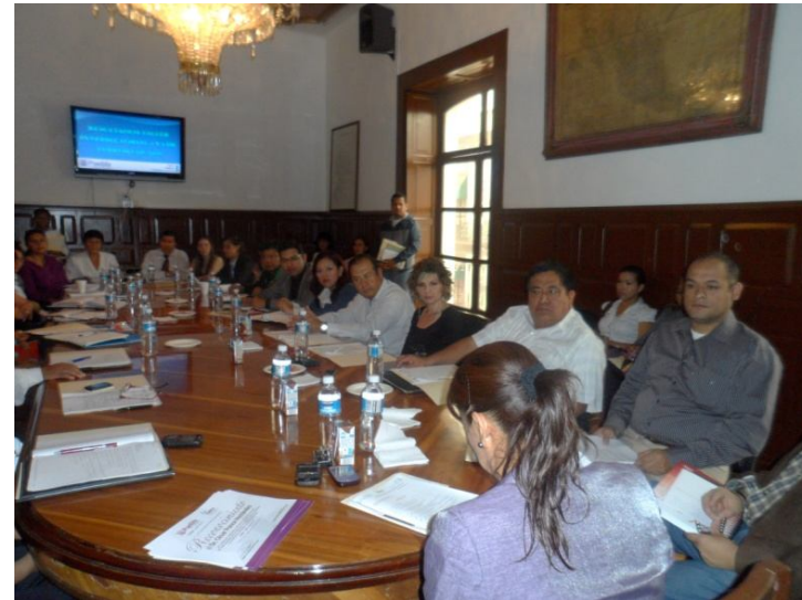
Segunda Sesión celebrada el 27 de marzo de 2012, llevada a cabo en la sala María Eugenia Mena de la Sala de Regidores