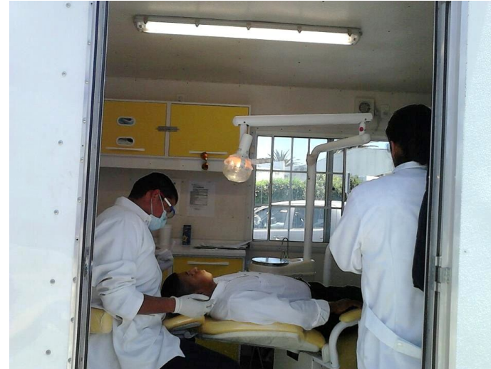
Mercado Municipal "DEFENSORES DE REPÚBLICA" 11 de Marzo de 2012.