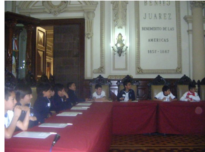
Sesión del Cabildo del Programa “Hoy soy Regidor”. El 17 de Febrero del 2012, se lleva a cabo Sesión del Cabildo del Programa “Hoy soy Regidor”.